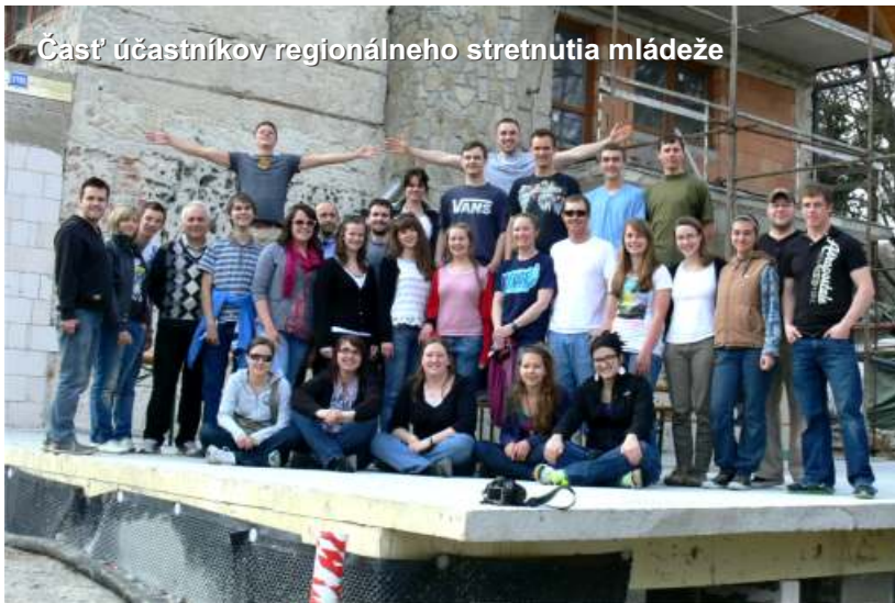
Časť účastníkov regionálneho stretnutia mládeže