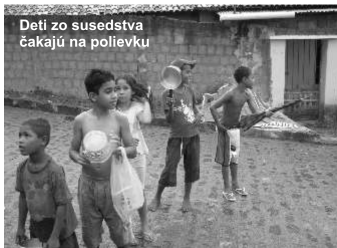
Deti zo susedstva čakajú na polievku