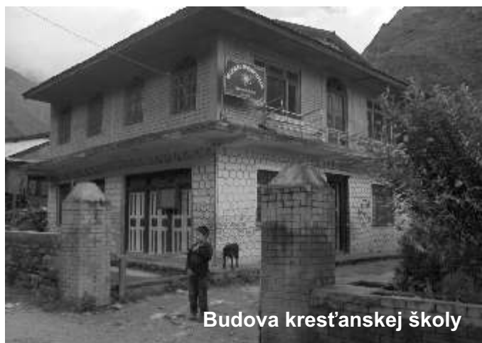
Budova kresťanskej školy