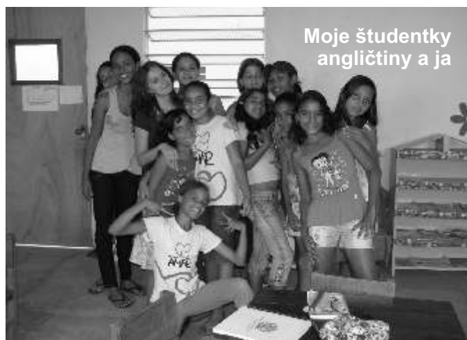
Moje študentky angličtiny a ja