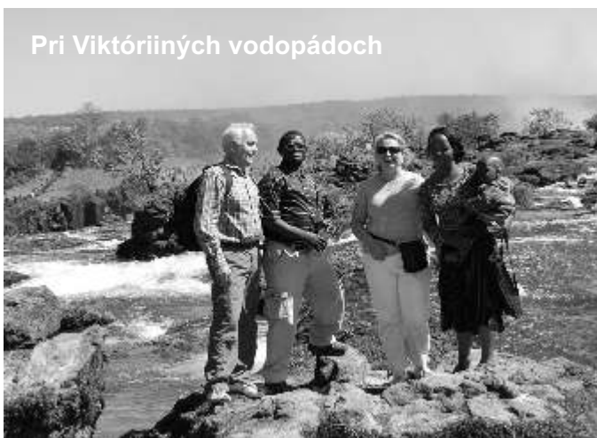
Pri Viktóriiných vodopádoch