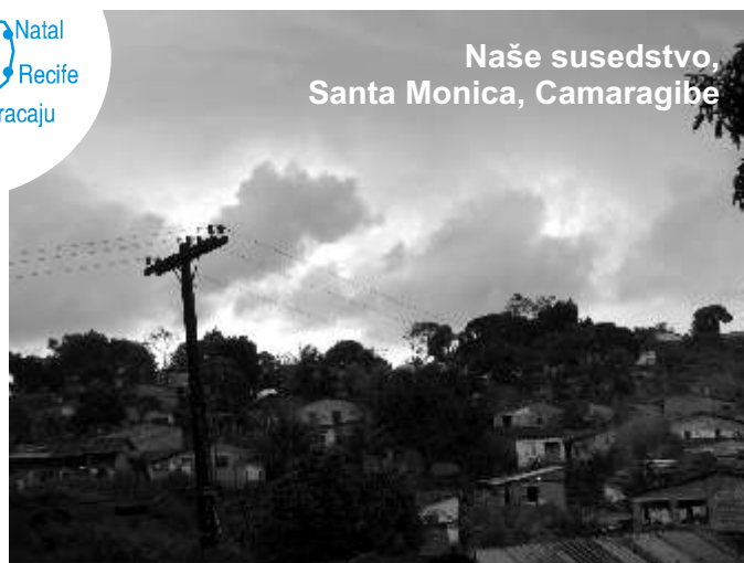
Naše susedstvo, Santa Monica, Camaragibe