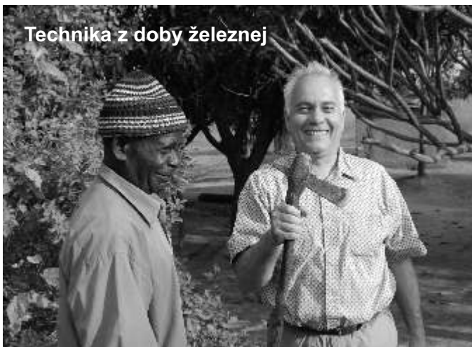
Technika z doby železnej