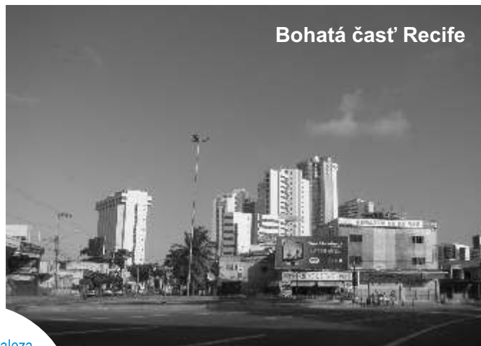
Bohatá časť Recife