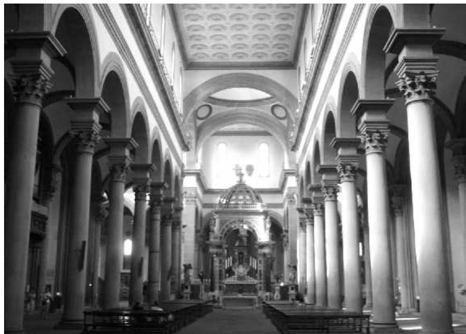
Interiér Santo Spirito, Florencia, projektovaný Filippom Brunelleschim, r.1436

Bol to Pán Ježiš, ktorý na rozlúčku povedal svojim učedníkom v jednej vete obe stránky budúcnosti: Na svete budete mať súženie, ale dúfajte, ja som premohol svet. (J 16,33) Začiatok tejto reči je omnoho optimistickjší: ... keď odidem a pripravím vám miesto, zase prídem a poberiem vás k sebe, aby ste aj vy boli tam, kde som ja? (Jn 14:3 -3 SEVP) Tieto a mnohé ďalšie verše Biblie platia pre znovuzrodených kresťanov.